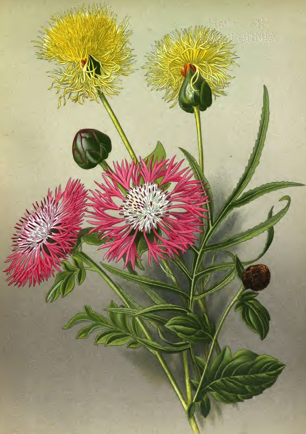
Centaurea jacobinica (Lam.) и dealbata (Wild.) Василек сизый и белесоватый.